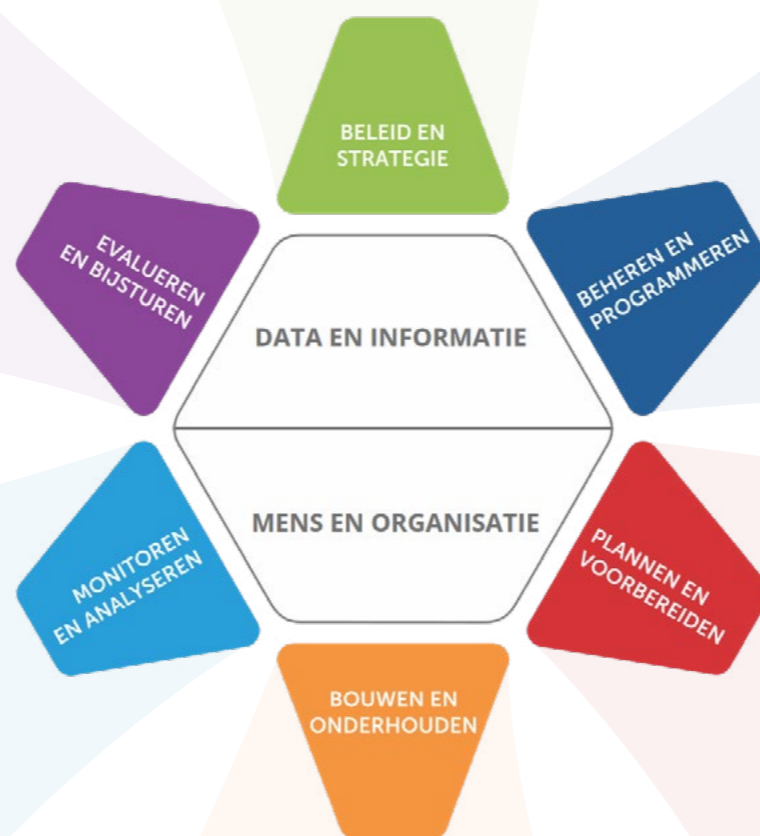
Het iAMPro model voor assetmanagement